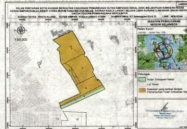
CADANGAN keluasan yang ingin dinyahwartakan HSKLU untuk projek pembangunan bercampur.

HSKLU yang diwartakan pada 13 Mei 1927 dan terletak di Mukim Tanjung 12, Daerah Kuala Langat, Selangor menjadi perhatian umum susulan daripada notis penyasatan awam di bawah