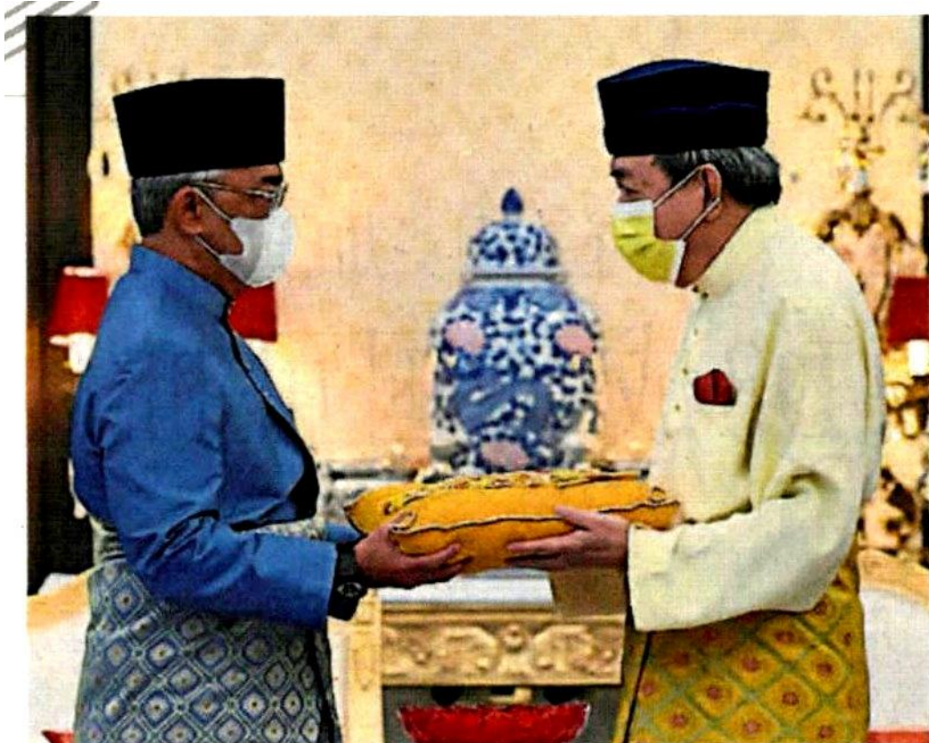
阿都拉陛下（左）颁赠彭亨王室一级勋章给雪州苏丹沙拉弗丁。