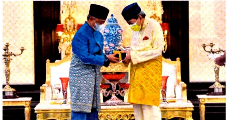
Al-Sultan Abdullah berkenan mengurniakan cendera kenangan kepada Sultan Sharafuddin pada Istiadat Persembahan Darjah Kerabat (DK) Pahang dan DK Selangor di Istana Negara, semalam.

Istiadat itu turut disaksikan Pemangku Raja Pahang, Tengku Hassanal Ibrahim Alam Shah Al-Sultan Abdullah dan Raja Muda Selangor, Tengku Amir Shah. BERNAMA