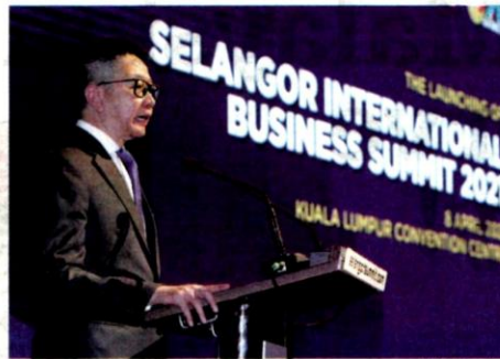
Teng says the physical interactions are vital to ensure a higher success rate of SIBS, which aims to attract more than 840 booth registrations and 15,000 trade visitors this year

"Through this initiative, short-term travellers may be exempted