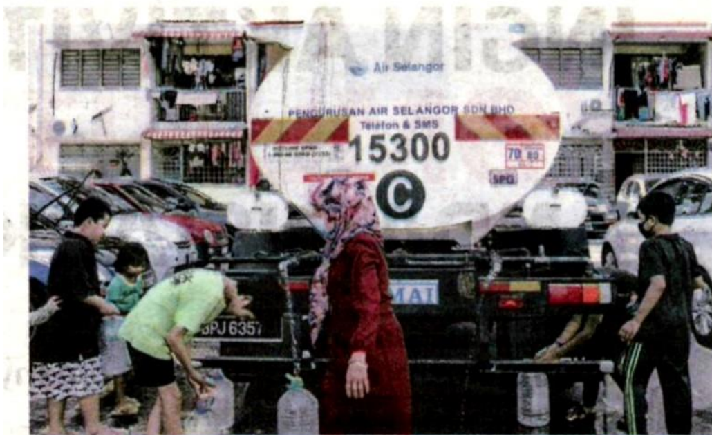
SEBAHAGIAN besar penduduk tidak perlu lagi menadah air apabila gangguan bekalan telah pulih. – GAMBAR HIASAN

Gangguan bekalan air berlaku sejak Selasa lalu apabila kerja-kerja penggantian injap itu bermula pukul 9 pagi.