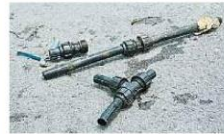
进行偷水活动的回收工厂利用直径32毫米的聚乙烯输水管偷取净水。

他呼吁民众一旦发现任何偷水活动，可向国家水务委员会（03-8317 9333）做出投报。