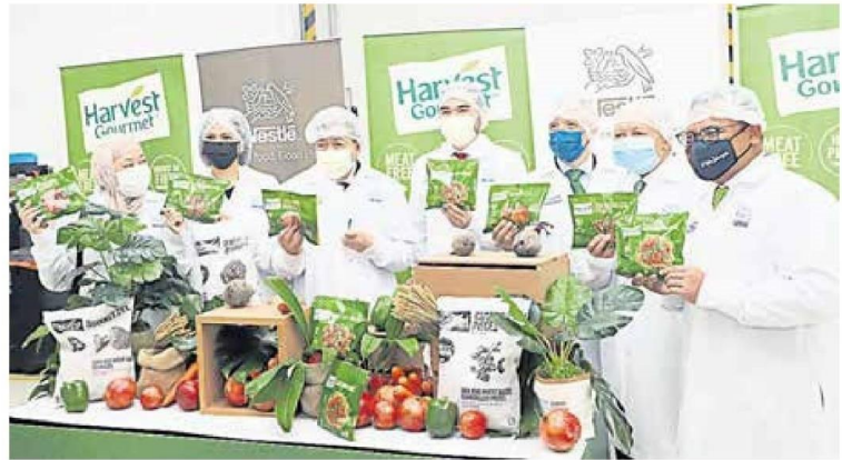
■雪州苏丹沙拉弗丁（左三）在苏丹后诺拉茜京（左二）陪同下，与众人推介大马雀巢植物肉品牌“嘉植肴”系列产品。右起为阿鲁丁、赛安华、阿拉诺及储东姑阿米尔沙。

(沙亚南7日讯) 国际食品业巨头雀巢有感于东南亚市场尤其是马新对植物肉的需求，以及未来食品消费趋势倾向健康及环保路线，注资1亿5000万令吉，在雪州沙亚南15区工业区新建厂房和启动东南亚首个、亚洲第二的先锋素食植物基产品生产线。